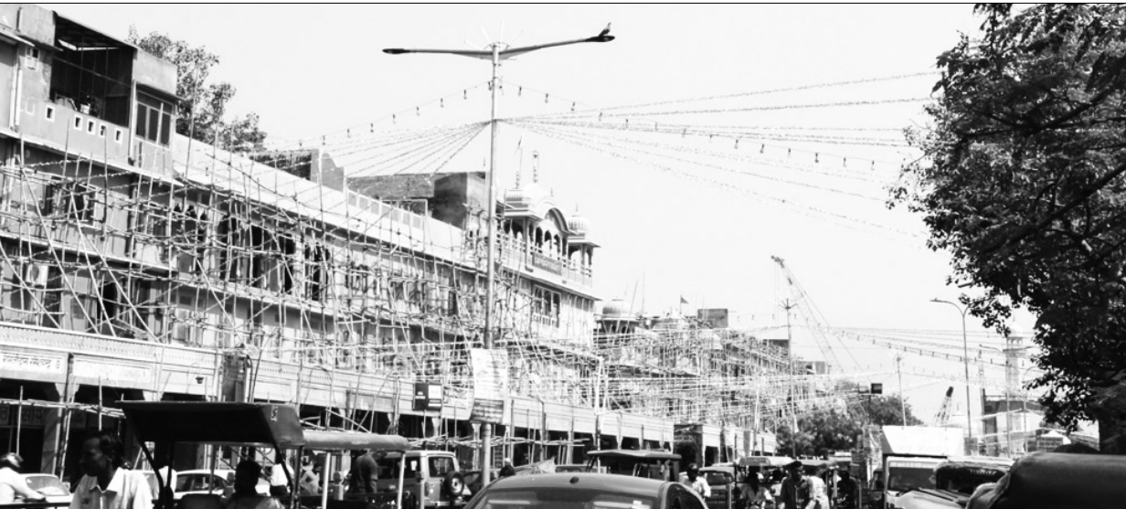
परकोटे में स्मार्ट सिटी योजना के तहत पुरानी इमारतों के रंगरोगन का कार्य तेजी से चल रहा है। अबकी बार दीपावली सजावट की रोशनी के बीच शहर की इमारतों में सौंदर्यीकरण के बाद ओर भी ज्यादा निखरी हुई नजर आएगी।

फैले इसके लिए विभिन्न निर्णय लिए गए। बैठक के दौरान अक्टूबर माह के अंतिम सप्ताह से प्रदूषण नियंत्रण मंडल, रीको, जयपुर विकास प्राधिकरण एवं संबंधित इंडस्ट्रियल एसोसिएशन द्वारा द्रव्यवती नदी के आस-पास के क्षेत्र में स्थित सभी उद्योगों का संयुक्त निरीक्षण किया जाएगा। बैठक में सभी औद्योगिक संघों से आग्रह किया गया कि वे अपनी सदस्य इकाइयों से शून्य निस्त्राव की शर्तों की पालना करवाना सुनिश्चित करें एवं सभी उद्योगों को नवम्बर माह के अंत तक उच्छिष्ट उपचार संयंत्र में आवश्यक सुधार करने के लिए निर्देश भी दिए गए। सांगानेर क्षेत्र में स्थित रंगाई-छपाई इकाइयों को भी उच्छिष्ट उपचार संयंत्र नियमित रूप से संचालित करने के लिए निर्देशित किया गया।